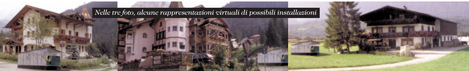
Nelle tre foto, alcune rappresentazioni virtuali di possibili installazioni

richiede particolare manutenzione e soprattutto, visto l'esempio di Varallo, non necessita di particolari autorizzazioni. Il box risulta ben difeso dagli agenti atmosferici, è provvisto di isolamento termico sufficiente e le aperture presenti favoriscono una buona aerazione tale da garantire un ambiente salubre e privo di umidità per gli animali presenti". Ci auguriamo che venga capita l'utilità di questa idea e che molti possano adottarla per offrire una valida soluzione a chi si deve muovere in città e non abbandoni il cane dentro un'auto e vada contro agli stessi regolamenti comunali e alle normative sul benessere degli animali, specialmente in alcuni periodi dell'anno.